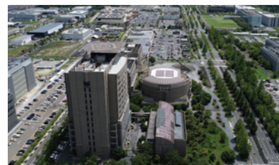
公益財団法人 関西文化学術研究都市推進機構 産業・イノベーション推進室

RDMM支援センターは、未来のものづくり・研究開発には産官学だけでなく、生活者としての住民の方の幅広いアイデアやご意見が必要だと考えています。Clubけいはんなのサポーターの皆様とのインターネットアンケートや参画型調査を通じて未来の産業・商品づくりを産官学住で創っていきたくと願っています。