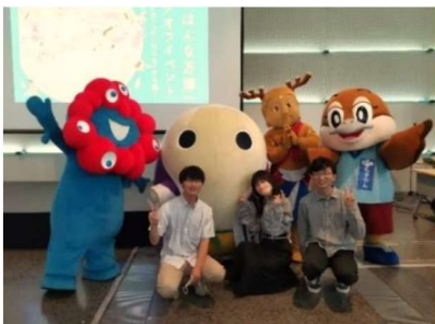
6月3日(月) グランフロント 大阪にて行われた けいはんな万博キックオフイ ベントにて3名の学生さんが 登壇しました

ミーティングは参加メンバーの自主性を尊重して 行いますので自由参加。予定が合う時のみの参加も OKです。