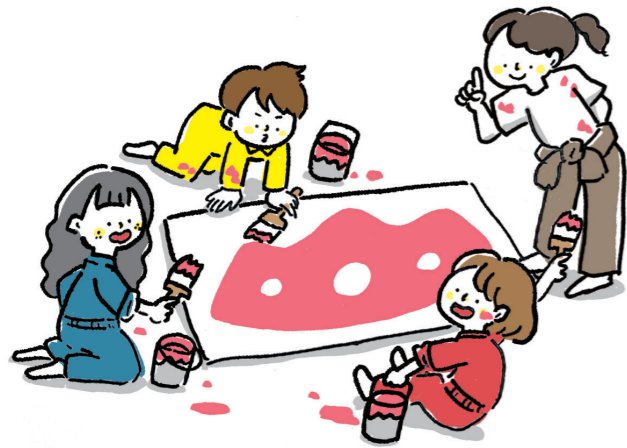
木津川アート参加アーティストによるワークショップを今年も開催予定!

このイベントの見どころは、アート作品が配置される場所が大きな美術館などではなく、普段いろんな人たちが暮らしている街の中に展示されるということ。開催期間中はいつもの街並みや風景の中にアート作品が展示されるので、誰もが暮らしの中で現代アートにふれることができるイベントなんだって!今回は、そんな木津川アートについて詳しくお話を伺ってきたよ。