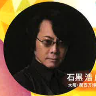
石黒 浩氏 大阪・関西万博プロデューサー