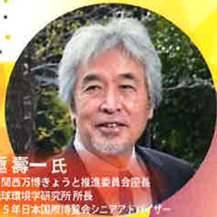
山極 壽一氏 大阪・関西万博きょうと推進委員会 座長 総合地球環境学研究所 所長 2025年日本国際博覧会シニアアドバイザー