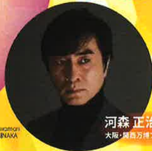
河森 正治氏 大阪・関西万博プロデューサー