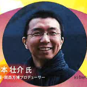
藤本 壮介氏 大阪・関西万博プロデューサー