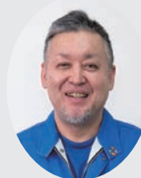
工場長による 現場ナマの声を紹介

京都で生まれ、自動車メーカー勤務を経て1992年塗装会社の2代目と結婚。ザ・昭和な工場風土に驚愕！親世代社員との交流に四苦八苦しながらも独自の取組を展開。2019年女性活躍セミナー、2021年子育て環境日本一、2022年中小企業のDX、2023年魅力ある職場づくり等で紹介され、「京都モデル」ワーク・ライフ・バランス企業に認証。